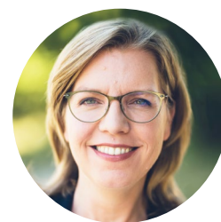
↑ Leonore Gewessler, BA Bundesministerin für Klimaschutz, Umwelt, Energie, Mobilität, Innovation und Technologie Minister for Climate Action, Environment, Energy, Mobility, Innovation and Technology

I am delighted that AustriaTech and its team are contributing their expertise and resilience to help us on our way to a climate-neutral Austria by 2040.